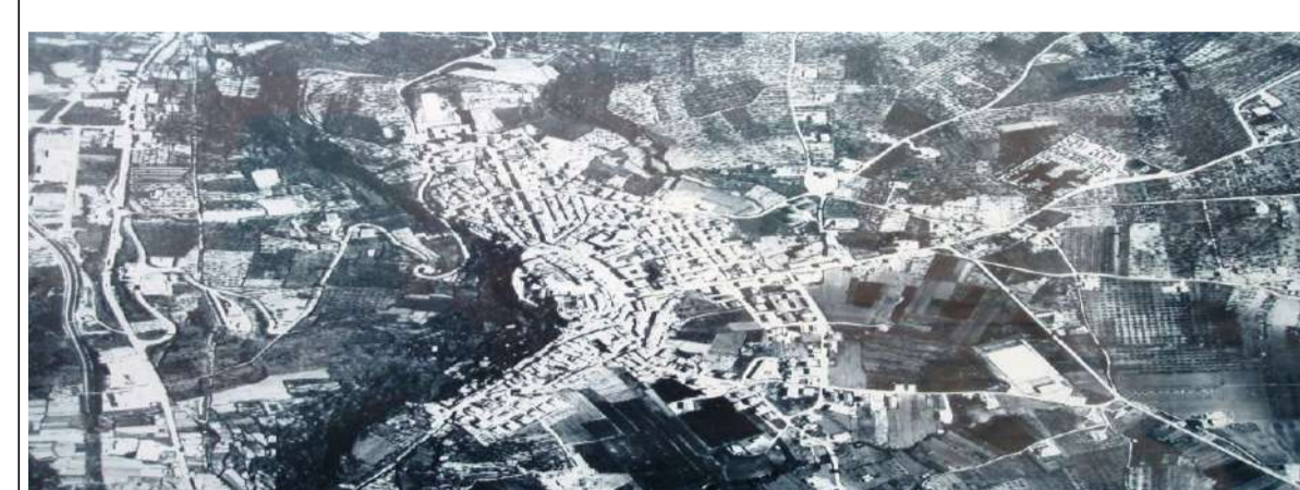
COMUNE DI FICO DI CADORNA PROVINCIA DI PESCARA

tavola n. 2 - centro abitato 1:2000 Elaborato aggiornato come da determinazione conclusiva Ufficio Tecnico n. 227 del 24/09/2021