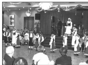
La festa al club, dedicata ai bambini.