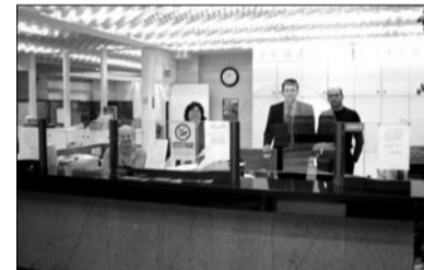
il direttore con i suoi validi collaboratori

credito (classiche o prepagate), internet banking, tante soluzioni di investimento ad hoc per le singole esigenze e forme di finanziamento personali, così come