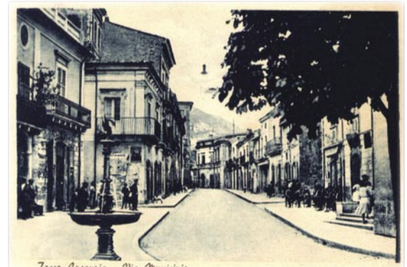
Via Municipio - cartolina Tipografia Camera.

Inviare le vostre cartoline storiche di Tocco. Le pubblicheremo insieme alla foto o al disegno della stessa zona come è oggi.