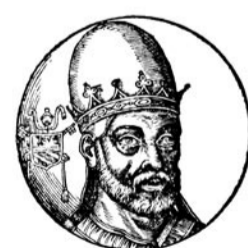
Onorio III Il Cardinale Cencio Savelli, romano, canonico di S. Maria Maggiore, canonico sotto Clemente III e Celestino III, fu eletto papa il 18 luglio del 1216. Morì il 18 marzo del 1227 e fu sepolto in S. Maria Maggiore.

ricordiamo che prima della festa cristiana, in questo periodo c'era una serie di ricorrenze e riti legati al mondo rurale. Gli antichi Romani dal 17 al 24 si festeggiavano i Saturnali in onore di Saturno, dio dell'agricoltura, ed era un periodo dove si viveva in