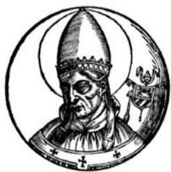
San Liberio Papa Papa romano, successe a Giulio II il 17 aprile del 352. Fece erigere la basilica di S. Maria Maggiore. Morì il 24 settembre del 366 e fu sepolto nel cimitero di Priscilla.

Volendo fare un po' la storia della festa di Natale, una delle feste principali dell'anno, si deve tornare molto indietro nel tempo, addirittura all'antica Roma. Il Natale della Cristianità occidentale cade il 25 dicembre, giorno che fu sanzionato ufficialmente come Natale di Gesù da Papa Liberio nel 354, mentre nella Cristianità orientale cade il 6 gennaio. La tradizione cristiana si intreccia con quella popolare e soprattutto contadina, perché