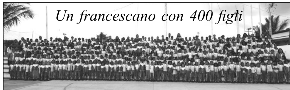
Un francescano con 400 figli